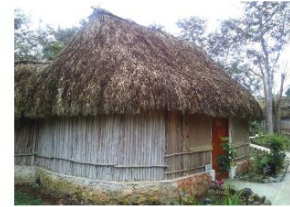
Sitio de Turismo Rural y Ecoturismo Ek' Balam